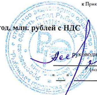
График реализации инвестиционной программы на 2023 год, млн. рублей с НДС